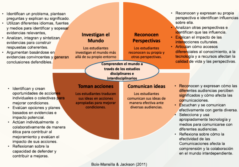
Figura 1. Dimensiones para la formación de una ciudadanía global.