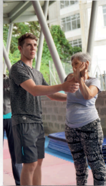
ACTIVIDAD FÍSICA SENIOR